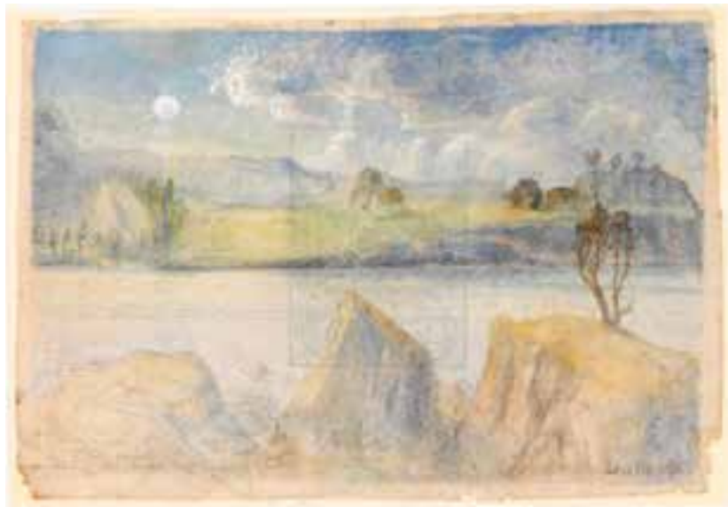
Lars Hertevig, Landskap, akvarell. Stavanger kunstmuseum.